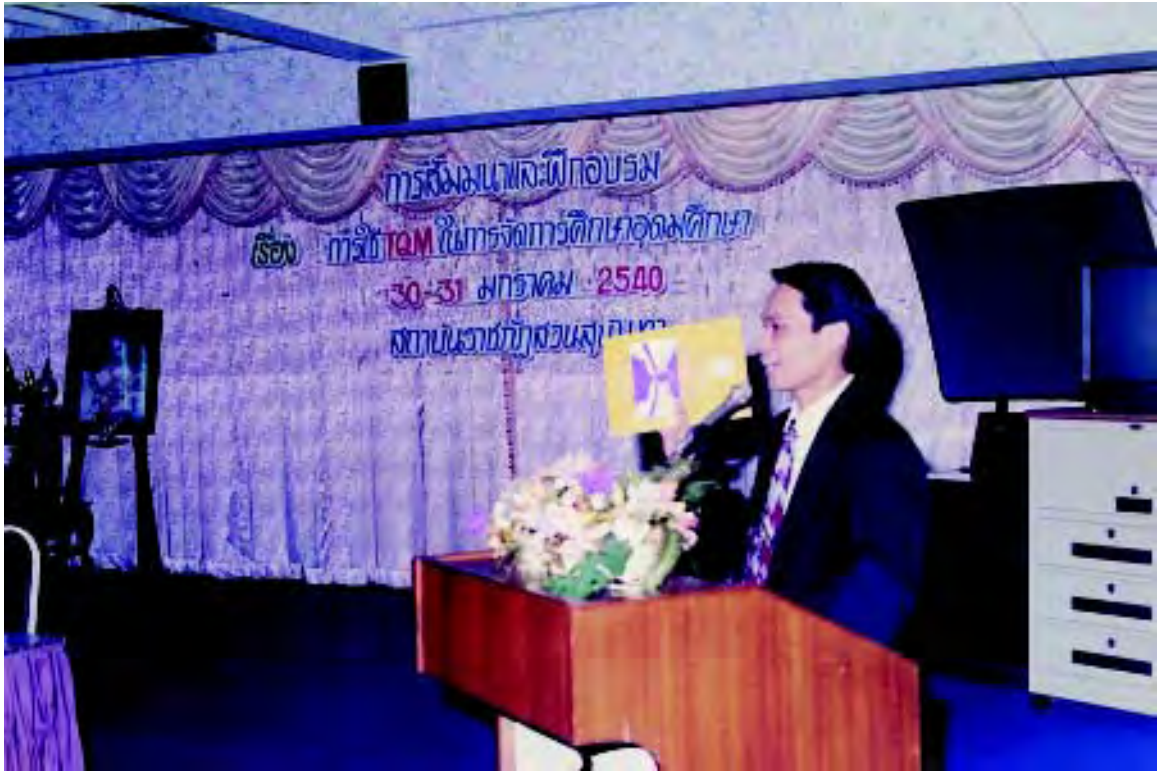
ภาพที่ ๑ การฝึกอบรม TQM ของผู้บริหารมหาวิทยาลัยในปีพ.ศ.๒๕๔๐

หลังจากที่มีการ re-design ระเบียบปฏิบัติงานทั้ง ๗ งานแล้ว ได้มีการนำมาใช้ในงานฝ่ายวิชาการ โดยเฉพาะสำนักส่งเสริมวิชาการในฝ่ายทะเบียนและวัดผล นอกนั้นไม่ถูกนำมาใช้และไม่มีการนำลงไปสู่การปฏิบัติ ด้วยสาเหตุหลายประการ โดยเฉพาะ commitment ของผู้บริหารในแต่ละหน่วยงาน และที่สำคัญคือการไม่มีการ empower จากผู้บริหารระดับสูงทำให้เป็นปัญหาในการกระจายงานลงสู่การปฏิบัติ จึงไม่มีการขยายผลเท่าที่ควร