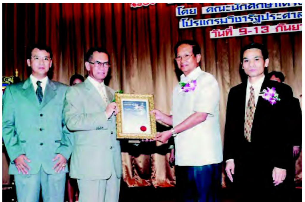
ภาพที่ ๒ การมอบรางวัลและ certificate ISO9000:2000 จากพณฯ ปองพล อติเรก รัฐมนตรีกระทรวงศึกษาธิการ

ในเวลาต่อมาในช่วงปี พ.ศ.๒๕๔๔ - ๒๕๕๑ มหาวิทยาลัยจึงได้กำหนดเป้าหมายในการบริหาร โดยที่จะนำเอาแนวคิดและปรัชญาของ TQM มาเป็น business strategy และใช้ strategy focus ในการบริหารจัดการมหาวิทยาลัย โดยกำหนดยุทธศาสตร์การจัดการมหาวิทยาลัยไว้ ๘ ด้านได้แก่