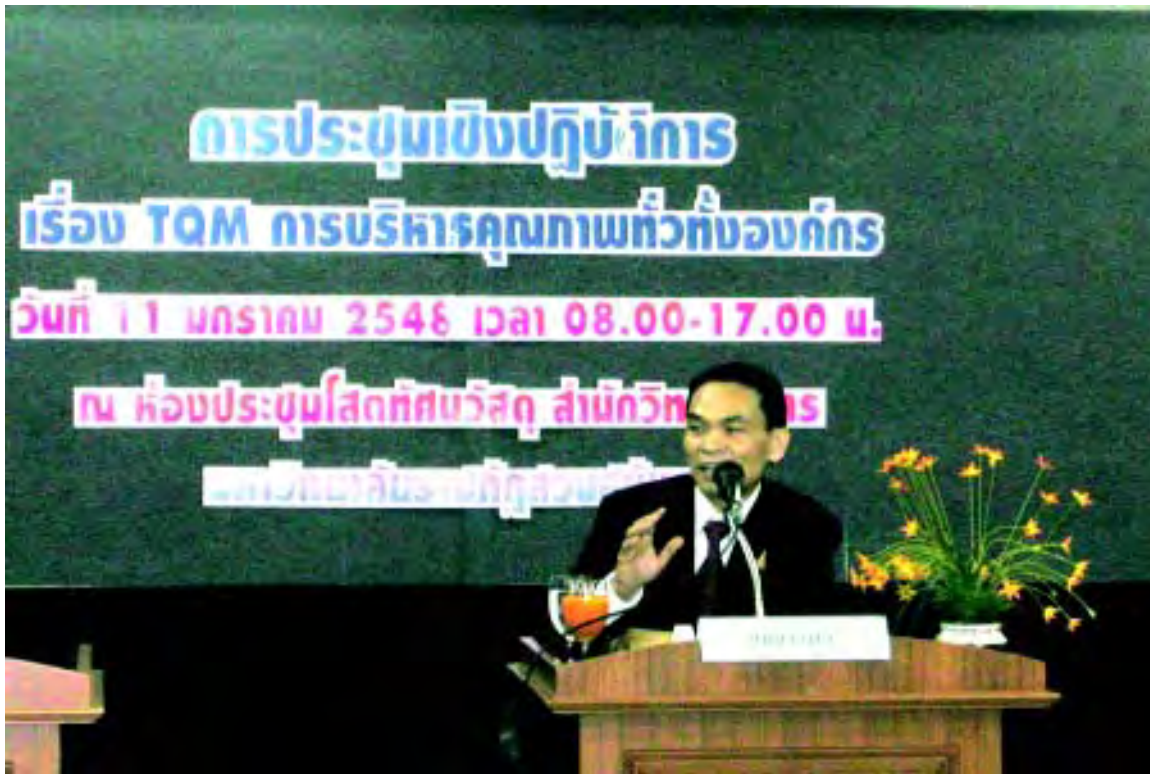
ภาพที่ ๔ การฝึกอบรมปรับปรุงคุณภาพการปฏิบัติงานที่มีมาตรฐานหรือ SOP

หลังจากที่มีผ่านการฝึกอบรมและดำเนินการโครงการนี้ไปแล้ว ในช่วงประมาณเดือนที่ ๑๐ ถึง ๑๑ ของโครงการ จะมีการประกวด SOP ของหน่วยงานต่าง ๆ ทั่วทั้งมหาวิทยาลัยเพื่อหา best practice จากผลการ implement และมาคัดเลือกให้ reward และ recognition แก่ข้าราชการและพนักงานมีผลการปฏิบัติงานที่ดี จาก best practice ของงานที่ได้มาตรฐานจะนำไปลงระบบ KM (knowledge management) ในระบบ ERP (Enterprise Resources Planning) ของมหาวิทยาลัยเพื่อการ share knowledge ของพนักงานมหาวิทยาลัย รวมทั้งจัดงาน TQM celebration ด้วย